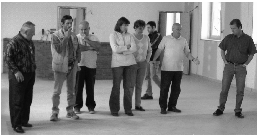
Une partie du conseil municipal en pleine réflexion

C'est fait, l'ancienne école est devenue le Centre Associatif et Culturel. Le village est maintenant équipé d'une salle pratique et belle. L'ensemble des habitants sera bientôt invité à venir la découvrir. Il est possible de la louer au tarif indiqué ci-après. La location est gratuite pour les associations de la commune. Il faut prendre contact avec la mairie pour réserver. La réservation n'est effective qu'après le règlement.