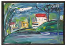
Hommage à PUTOV 27 juin - 18 août