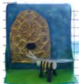
Centre Social Rural 1er juin - 29 juin