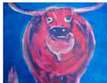
Chantal PRIN http://prinpeintre.perso.neuf.fr 1er juin - 21 juin