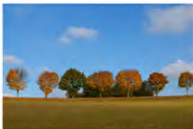
Jean-Luc DEJOUX 4 août - 23 août