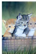
Philippe WANES 23 juin - 14 juillet