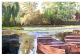
Louis DUMAS & Rolande DUMAS 16 juillet - 2 août